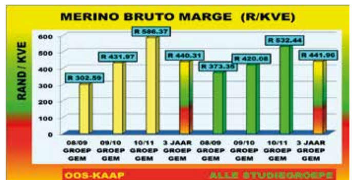
Figuur 3: Die 3 jaar gemiddelde Bruto Marges van die Merino

Die Bruto Marge (BM) van die Merino het die afgelopen 3 jaar dramaties toegeneem. Figuur 3 illustreer dat in die Oos-Kaap was die BM se gemiddelde toename oor die laaste 2 jaar 35.74%. Dit was 'n toename vanaf R 431.97/KVE in 2009/10 tot R 586.37/KVE in 2010/11 (R 154.40/KVE). Vir alle Merino studiegroepe was die BM styging in dieselfde tydperk 26.75%. Die toename was vanaf R 420.08/KVE tot R 532.44 (R 112.36/KVE). Die Oos-Kaap 3-jaar gemiddelde BM is R 440.31/KVE teenoor die 3 jaar gemiddelde BM van alle Merino studiegroepe van R 441.96/KVE.