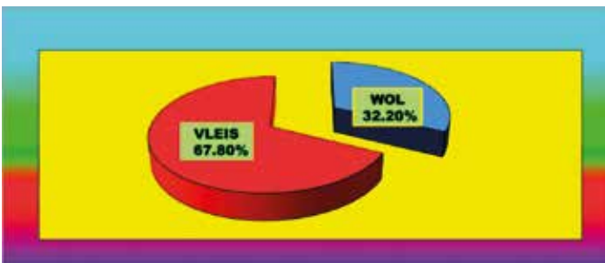
Figuur 1: Die 3 jaar gemiddelde wol-vleis verhouding van die Merino in die Oos-Kaap

Die studiegroep data bevestig dus die algemene norm van 70% vleis en 30% wol.