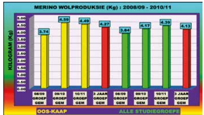
Figuur 2: Die 3 jaar gemiddelde wolproduksie van die Merino

Dit is duidelik dat die Oos-Kaap Merino gemiddeld meer wol afskeer per skaap as die gemiddeld van die res van die Merino studiegroepe. Dit bly noodsaaklik dat die Suid-Afrikaanse wolskeersel die internasionale standaard handhaaf. Die prysbepalende faktore van wol moet deur die Merino produsent as prioriteit beskou word met die vasstelling van 'n teelbeleid.